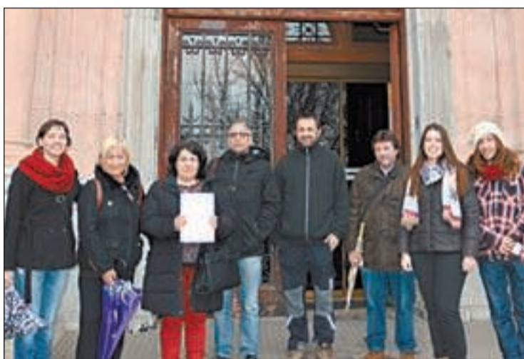
FOTO: / La Marea Lila registra la petición en la Subdelegación del Gobierno

amplia oferta artesana de palmas que adornarán el Domingo de Ramos. El horario de atención al público será de las 10.00 horas hasta 20.30 horas.