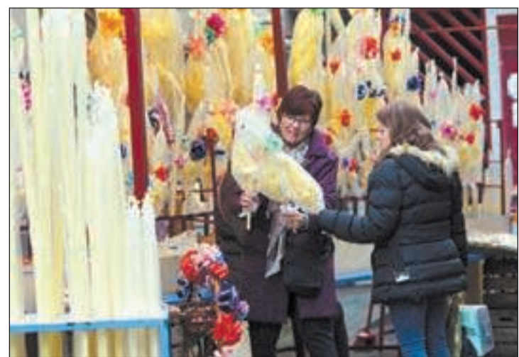
El mercado estará hasta el 20 de marzo

La concejalía de Hàbitat Urbà, Rural i la Sostenibilitat de la Paeria organizó ayer el segundo taller de ideas para elaborar la futura Ordenança del Paisatge de Lleida, que se prevé terminada después del verano. Los talleres tienen el objetivo de dar voz a todos los sectores implicados y recoger sus aportaciones e ideas en la futura normativa.