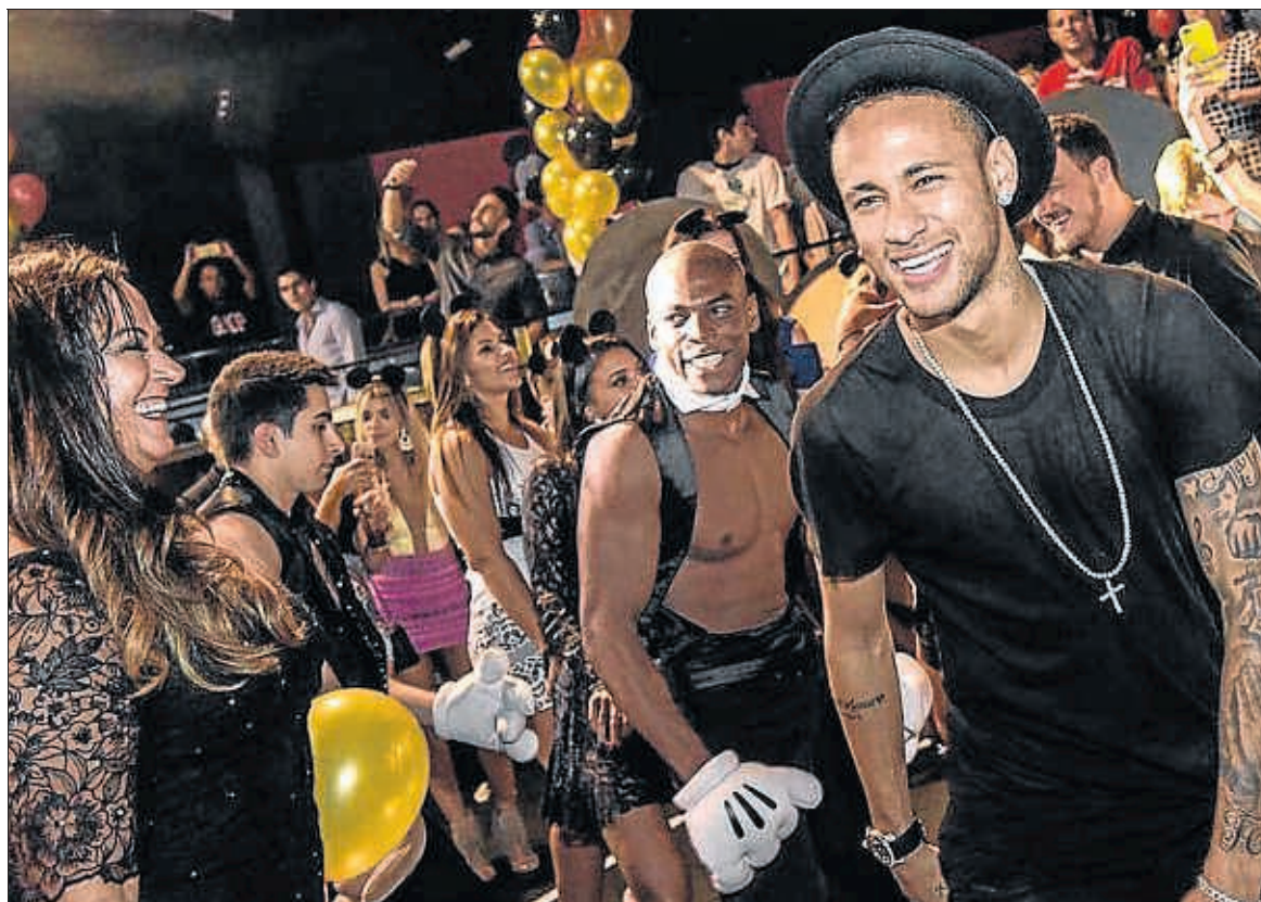
Neymar, somrient, a la festa d'aniversari de la seva germana

El principal conflicte, com de costum, és de dates, desgast físic a banda. Si el Barça arribés a la final de la Champions de Milà no acabaria la temporada fins al 28 de maig, només sis dies abans que comenci als Estats Units una nova edició de la Copa Amèrica. En canvi, els Jocs Olímpics no arrenquen fins al 5 d'agost. És a dir, que